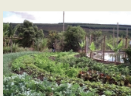
Irrigação com mandallas: garantia de produção

A ONG Agência Mandalla desenvolve desde 2003 um novo sistema integrado de produção, já implementado em 16 Estados. As mandallas são tanques com capacidade para até 30 mil litros de água que abastecem canteiros produtivos distribuídos à sua volta. O projeto conta com o apoio de entidades privadas, governamentais e não governamentais.