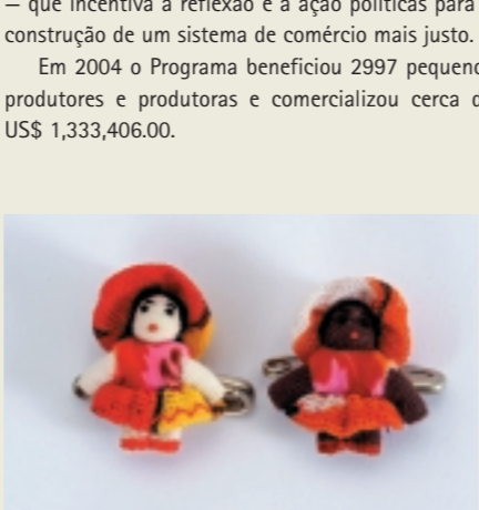
Broche Mini-bonecos, totalmente feito à mão. Produto artesanal brasileiro de maior demanda pelo Comércio Ético e Solidário (Fair Trade) na Bélgica, Luxemburgo e França. Produzido por grupo de mulheres de Apodi — RN, capacitadas, especialmente, em função desta demanda.

Em 2004 o Programa beneficiou 2997 pequenos produtores e produtoras e comercializou cerca de US$ 1,333,406.00.