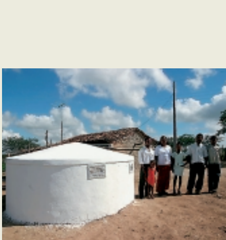
As cisternas garantem água para o consumo familiar

Qualquer grupo de pessoas, empresa ou entidade, pode participar do Programa apoiando o fortalecimento institucional da rede de ONGs que compõe a ASA ou financiando a construção de cisternas. Há pleno controle e transparência na aplicação de recursos e demonstração de resultados, através do Sistema de Informação, Gestão e Auditoria (SIGA), criado para gerenciar o Programa.