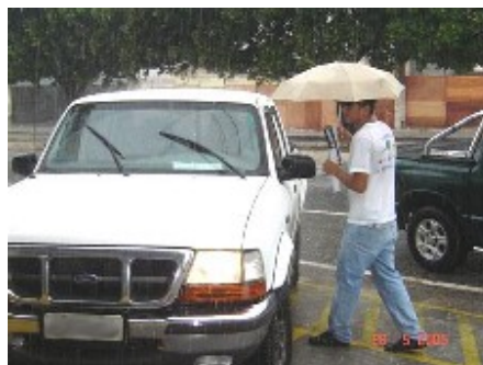
Jovens do Asa Branca