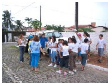
Amigos do Bairro e Escola Educar