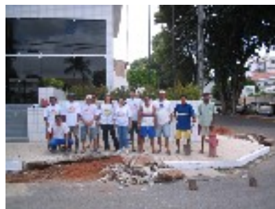
Tirol e Cidade Alta: a MultDIA, que articulou funcionários e pedreiros.