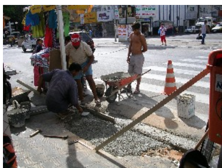
Associação de Comerciantes do Alecrim, que contratou pedreiros do Sinduscon.