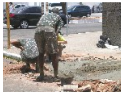
Tirol: as Assoc. de Distrofia Muscular e de Esclerose Múltipla, que articularam o Exército.