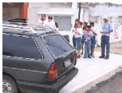
Grupos Escoteiros do Mar Artífices Náuticos e de Candelária.